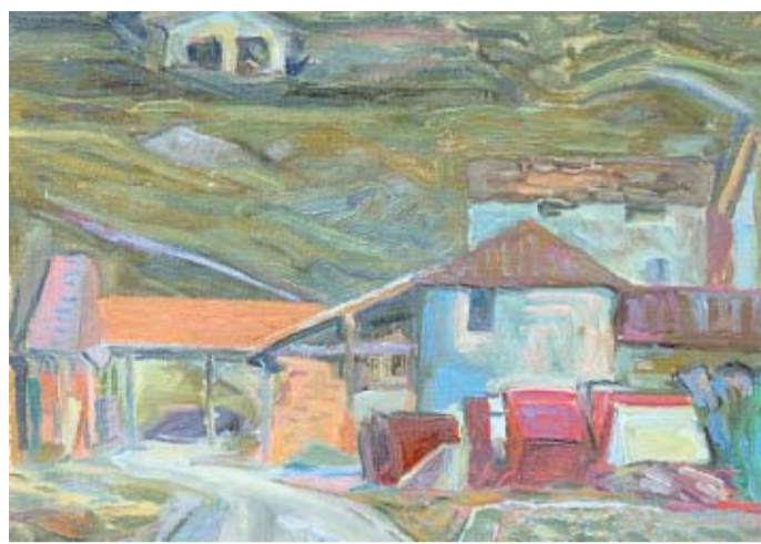
Goliardo Padova, Cantiere in val Brescia , olio, 1946

Una grande mostra sul pittore casalmagliese