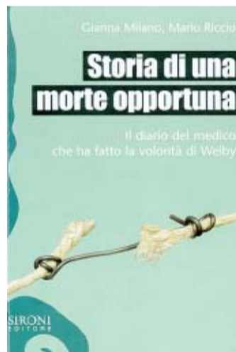
La copertina del volume

'Storia di una morte opportuna' un contributo all'etica